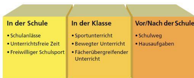
Modell: Bewegte Schule, BASPO

Das Modell der Bewegten Schule hat folgende Zielsetzungen: